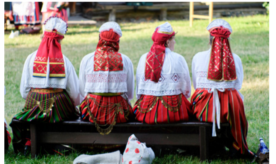
Hiiumaa rahvariided.

„Kuid me ei tahaks keskenduda ainult hiiu rahvariistele. Kutsume üles saare külalisi kandma meile külla tulles uhkusega oma rahvariideid. Pole vahet, kas tullakse lihtsalt puhkama