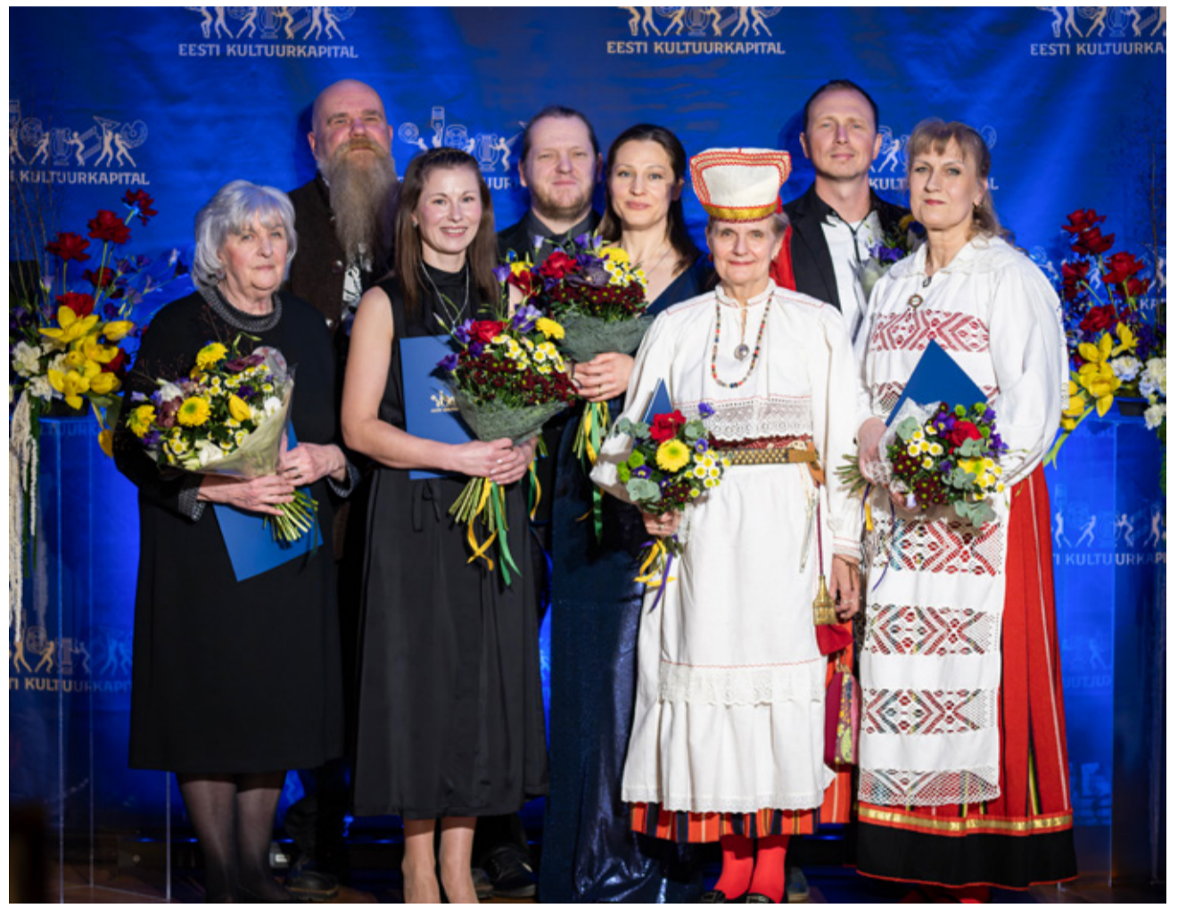
Kultuurkapitali preemiade nominendid.

maa kultuuri ja kunstielu andis Eesti Kultuurkapitali Hiiumaa ekspertgrupp Tiiu Valdmale .