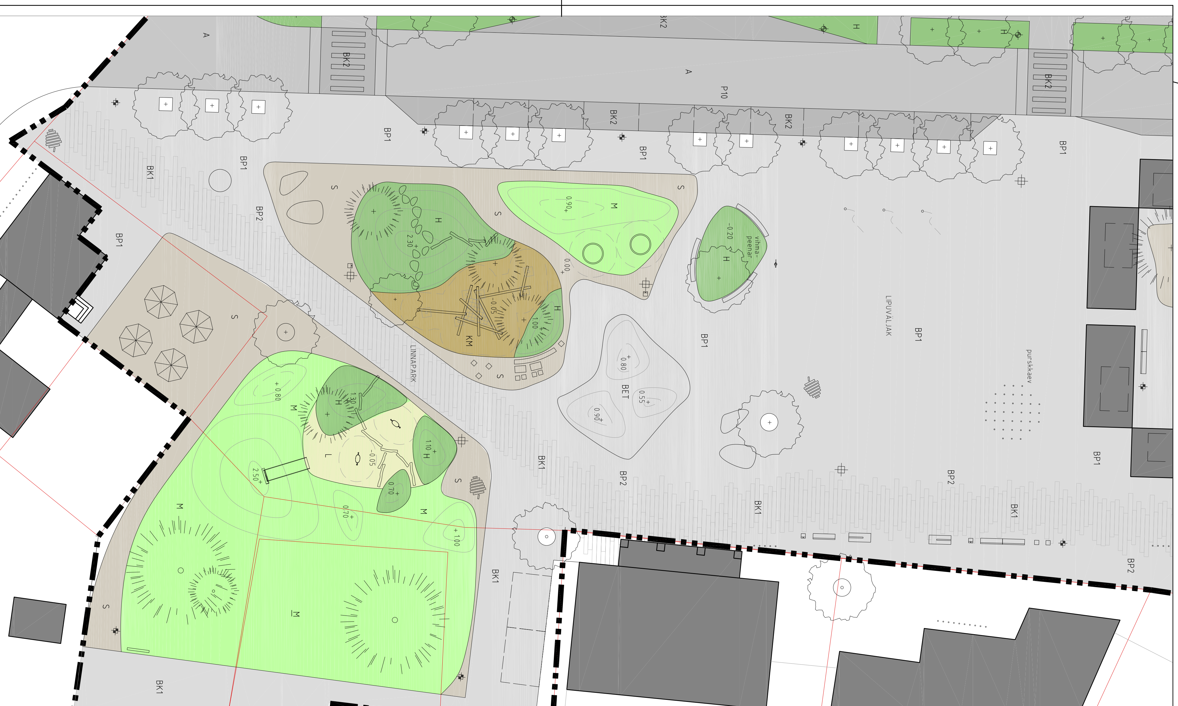
Väljaku detail 1:200 (A1)