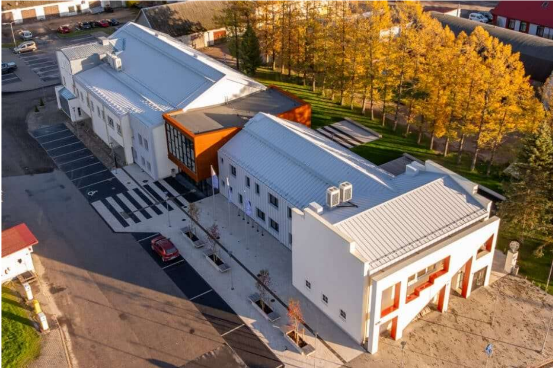
Käina kultuurikeskus 2025.a.